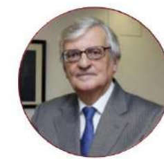
Eduardo Torres-Dulce Exfiscal General del Estado (2012 – 2014)