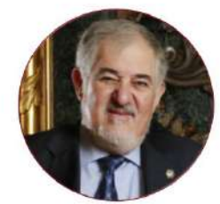
Cándido Conde-Pumpido Exfiscal General del Estado (2004 – 2011)