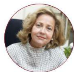
Consuelo Madrigal Exfiscal General del Estado (2015 – 2016)