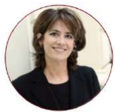
Dolores Delgado Fiscal General del Estado